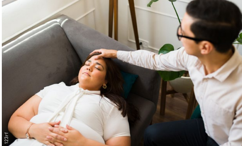
L’accompagnement du patient avant, pendant, et après son expérience, est le facteur clé de succès (ou, à l’inverse, d’échec) des thérapies psychédéliques.

dans le cadre des thérapies? De quelle manière utiliser les connaissances traditionnelles sur l’utilisation des psychédéliques? Les réponses à ces questions complexes et variées ne devraient pas être laissées à un seul groupe professionnel et ne devraient pas être considérées d’un seul point de vue. Ainsi, il est primordial de réfléchir et décider collectivement de la place que la société souhaite donner à ces substances.